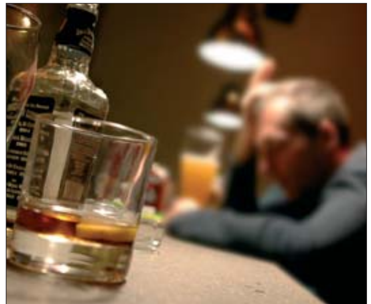
Was als Spaß beginnt endet bei einer Kontrolle meist mit Ernüchterung

Nach wie vor halten sich auch hartnäckig einige „Patentrezepte“, wie die Promille beeinflusst werden können. Da schwört man beispielsweise auf ein paar Löffel Olivenöl vor dem Gelage, eine Dose Thunfisch oder fettes Essen, weil Öl und Fett den Magen „auskleidet“. Einige essen Kartoffeln oder Zwiebeln, andere wollen dem Problem mit dem Konsum von Lakritze vorbeugen oder indem sie Zucker in die Getränke geben. Tatsächlich geschehen Alkoholaufnahme und -abbau nach ganz