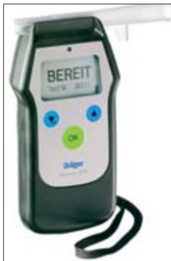
Promilleschnüffler: spricht der Pretester positiv an, ist der eigentliche Test fällig

Die Polizei scheint von dieser Maxime nicht viel zu halten, denn kein Fest, beinahe kein Lokal in dessen Nähe nicht der Alkoholttest „lauert“. Der kostet dann auch entsprechend vielen Fest- bzw. Lokalbesuchern den Lappen.