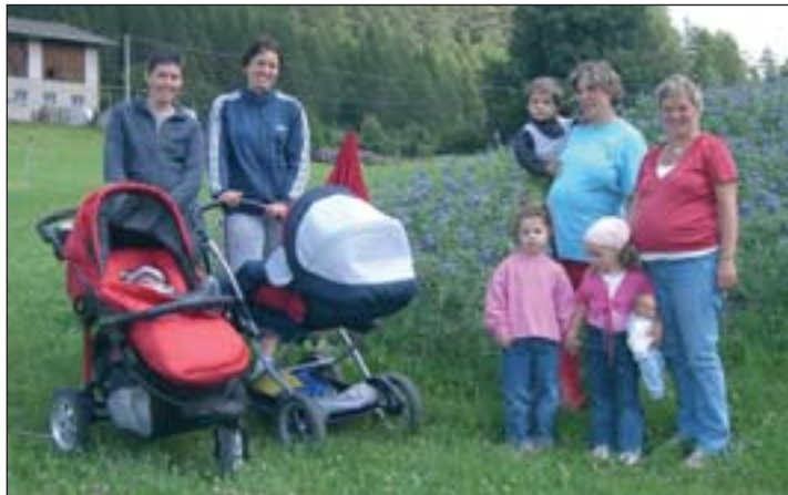
Altreier Mamas vor einem „Kaffeeackerle“ in der Fraktion Guggal