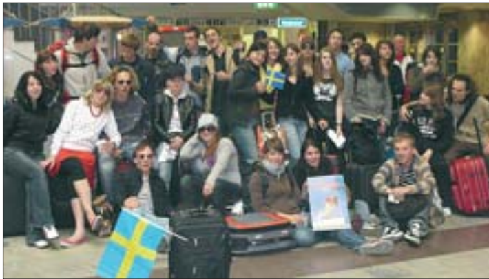
Von Südtirols Süden in den europäischen Norden.