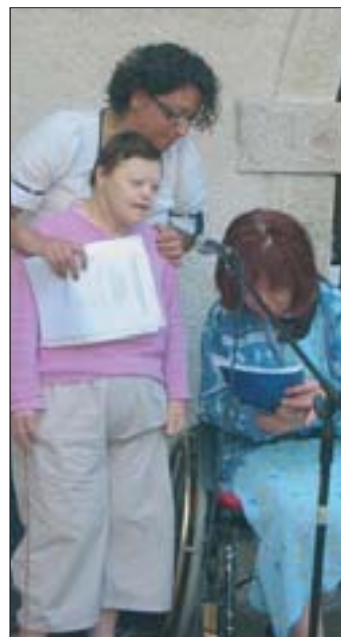
Die Bewohner erzählen von ihren Gefühlen und Lebenserfahrungen