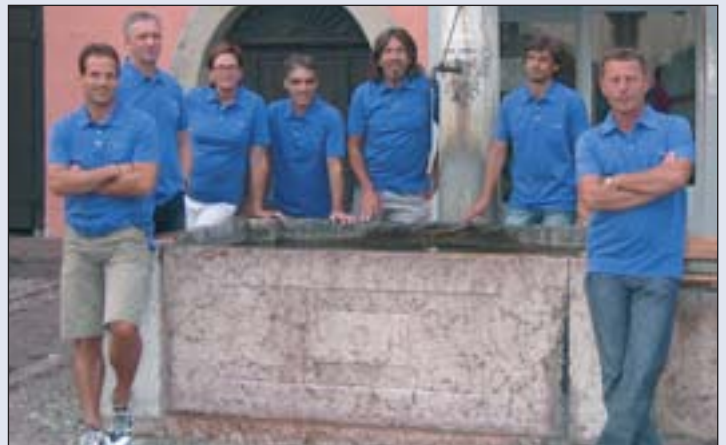
Das Laubenfest-OK Team