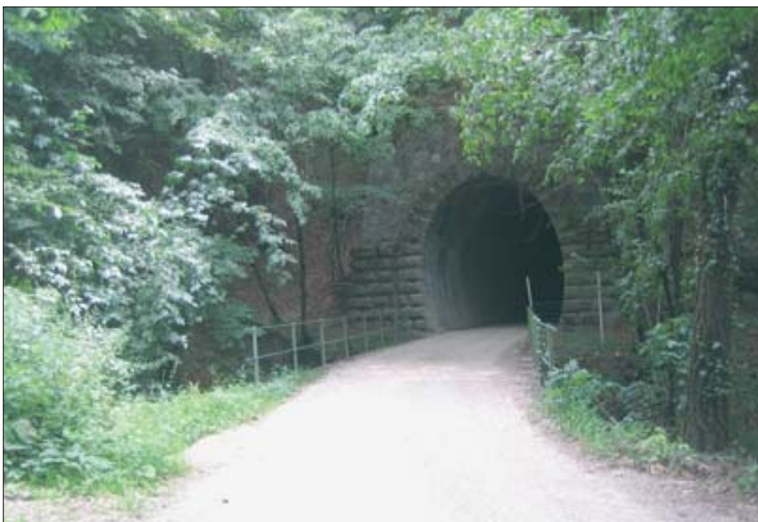
Besonderes Erlebnis für Radfahrer: Das Durchqueren der Tunnels

erfreut schon jetzt jene Radfahrer, die hier fernab der lauten Verkehrswege im Unterland noch viel Ruhe inmitten einer landschaftlichen Idylle finden. (RM)