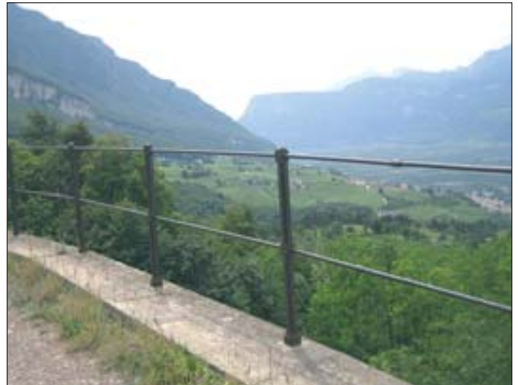
Wunderschöne Aussicht ins Tal vom Glener Viadukt

Derweil sorgt der „Bahnweg“ bereits für Bewegung, nicht nur bei Radfahrern, sondern auch in Tourismuskreisen. Alle Bahnhöfe sollen laut dem Projektanten Ing. Walter Pardatscher zu neuem Leben erweckt werden, entweder als Jausestation (Pausa), Rad-Jugendherberge (Kalditsch) oder als Radwerkstatt (Montan). Zudem sollen entlang der Strecke unter anderem Infostände, Kinderspielplätze und ein Naturlehrpfad entstehen. Das touristisch eher ruhige Gebiet rund um den „Bahnweg“ wäre damit um eine wichtige Attraktion reicher.