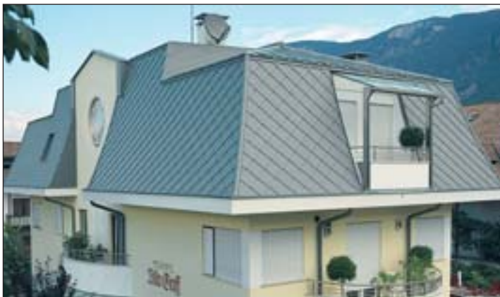
Villa Groff in Auer, Falzschablonen PREFA