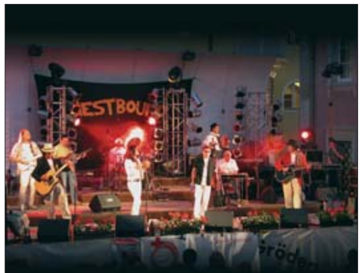
Die Show der Gruppe Westbound ist nicht nur musikalisch, sondern auch bühnentechnisch ein Highlight.

Südtiroler Rockgruppe Westbound die Seebühne zum Beben bringen. Ziel der Band war es immer schon, durch ihre Konzerte ein Zeichen der Solidarität mit Kranken oder Menschen in unterentwickelten Ländern zu setzen. Musik heilt die Welt ist ihr Motto. Westbound tritt kostenlos auf, die Band selbst besteht zum Großteil aus Ärzten. Bei dieser Sommer-Tour geht es darum, die Projekte der Vereinigung „Südtiroler Ärzte für die Dritte Welt“ zu unterstützen.