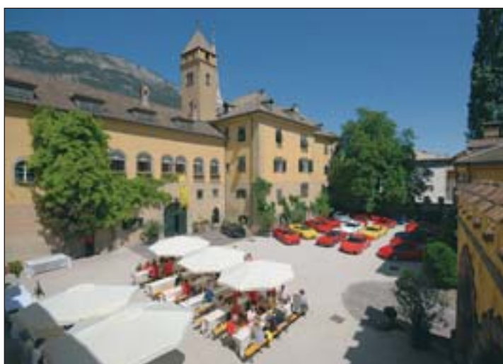
Der Schlosshof mit den Teilnehmern

Die im Schloss integrierte Kellerei verfügt über alle technischen Anforderungen der modernen Önologie. Das Ziel des Hauses ist es, Qualitätsweine herzustellen. Aus den Weinbergen, wo jeder Schritt kontrolliert werden