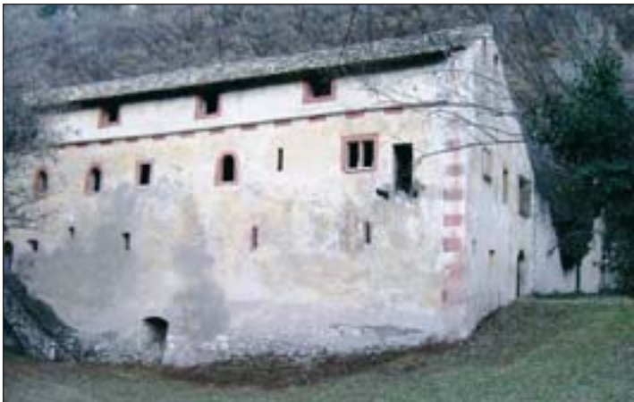
Bereits im Mittelalter trafen im Klösterle in St. Florian Vertreter unterschiedlicher Kulturen aufeinander. Nun erinnert das Theaterstück „Don Juan und Faust“ symbolisch daran.