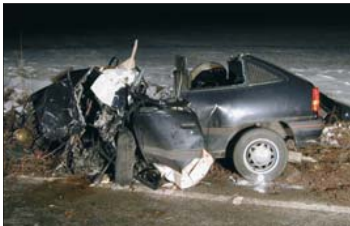
Was als Spaß beginnt endet oft aber auch tödlich

zum „Kater“ beiträgt, vor. Und noch eine Wahrheit am Ende: die einzig sichere Methode beim Alkoholttest nicht durchzurasseln, ist gar keinen Alkohol zu konsumieren, denn das Überschreiten der Grenze