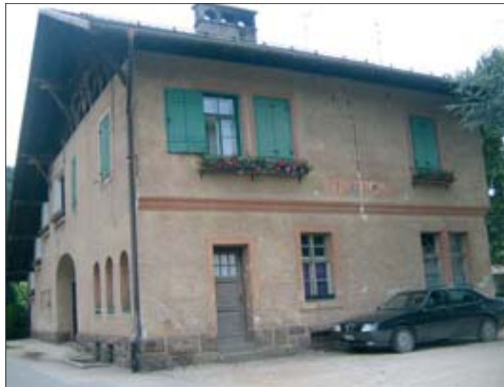
Der Bahnhof von Montan soll das Zentrum der Streckenwartung mit Dienstwohnung, Garagen und Abstellräumen werden.

Der geplante Radweg beginnt im Bereich der Brücke bei Schwarzenbach, führt über die erste Kehre („Learn“) weiter entlang der ursprünglichen Strecke nach Castelfeder. Vor der Bushaltestelle von Pinzon weicht der Weg von der ursprüngliche Trasse ab. Der Radfahrer muss hier die Straße überqueren und fährt dann auf gemeindeeigenem Weg Richtung Pinzon. Nach einem kurzen steilen Teilbereich im Ortskern geht es auf dem „Panoramaweg“ zurück Richtung Montan. Vom alten Bahnhof in Montan folgt der Radweg dem ursprünglichen Verlauf der Bahn, vorbei am Glener Viadukt, durch vier