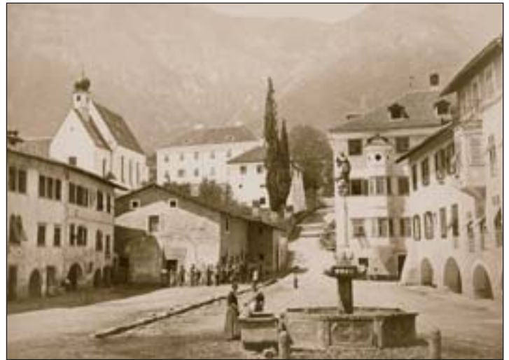
Der Kalterer Marktplatz vor über hundert Jahren

Jeder teilnehmende Betrieb wird an den kommenden Donnerstagen abwechselnd ein auf PVC gedrucktes historisches Bild in sein Schaufenster stellen. Ein roter Teppich wird den Weg dahin weisen.