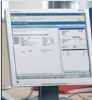
Das Internet bietet nicht nur eine Fülle von Informationen und Chancen sondern birgt auch beträchtliche Gefahren

Die unfairen Tricks im Internet: Vermeintliche Gratis-Angebote über Führerscheintests, Lebensprognosen oder Ahnenforschung. Wer sich bei den meist inhaltlich dürftigen Seiten voreilig registriert – im Glauben, dass sie gratis sind – bekommt auch schon eine saftige Rechnung. Die Behörden warnten neulich vor solchen Betrügereien und schlugen in diesem Zusammenhang gleich einige Präventivmaßnahmen vor. Registrieren Sie sich nicht vorschnell auf Webseiten mit Angeboten und Informationen über z.B. Lebensprognosen, SMS-Dienste, Vornamen, Lehrstellen,.... Solche Seiten sind oft nur am Tag der Registrierung gratis, dann verlängern sie sich in einen teuren Abo-Vertrag. Lesen Sie die gesamte Webseite und die Geschäftsbedingungen, bevor Sie sich auf Angebote oder Tests einlassen. Das Kleingedruckte