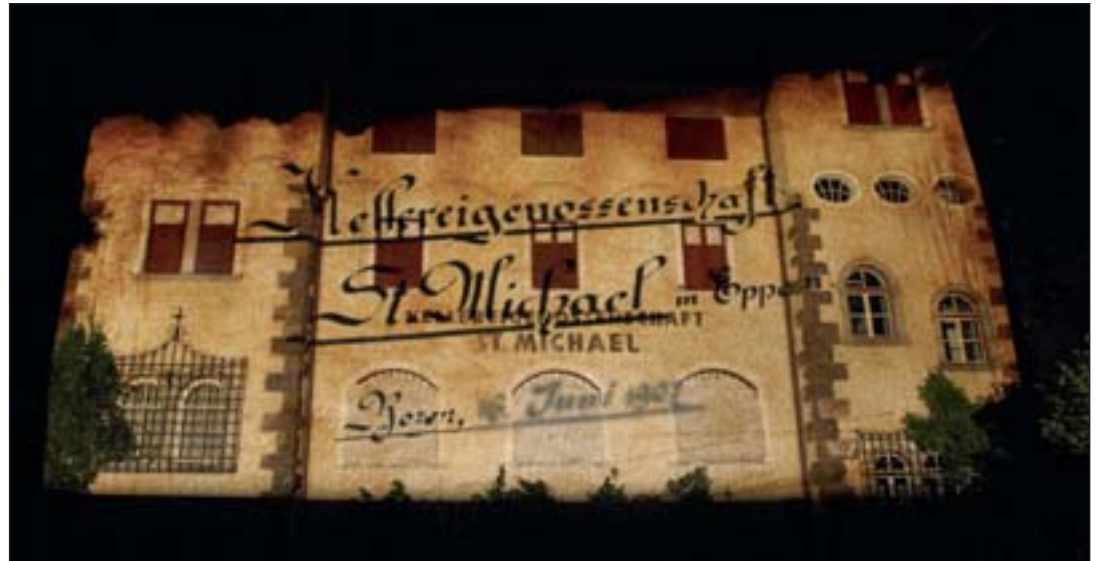
Lichtshow zum stolzen Jubiläum

In seinen Grußworten führte der Obmann aus, wie schwierig und unsicher die politischen und wirtschaftlichen Verhältnisse am Anfang waren. „Wenn wir heute inne und Rückschau halten, darf Dank und Anerkennung für unsere Vorgänger ebenso wenig fehlen, wie die Verantwortung und das Pflichtgefühl, dass wir dieses Werk fortsetzen, und unsere Kellerei weiterentwickeln für die kommenden Generationen,“ so der Obmann wörtlich.