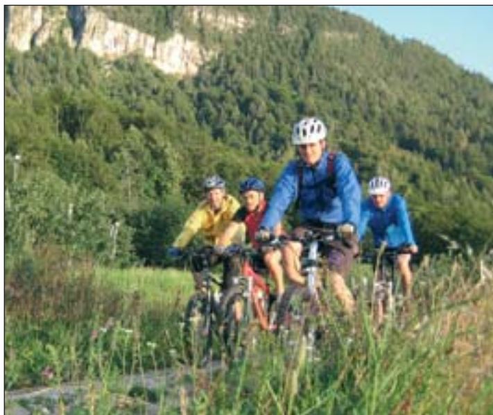
Reizvolle Landschaft – der Radweg führt unter dem Cisloner Berg vorbei...

Umweltschützer kritisieren den Trassenverlauf des Radweges, weil dieser auch durch das Biotop und Natura 2000 Gebiet Castelfeder führt. Die Vereinigung Italia Nostra hat deshalb gegen die Trasse im Biotop Castelfeder Rekurs eingereicht, doch auch in diesem Fall wurde die Beschwerde vom Verwaltungsgericht