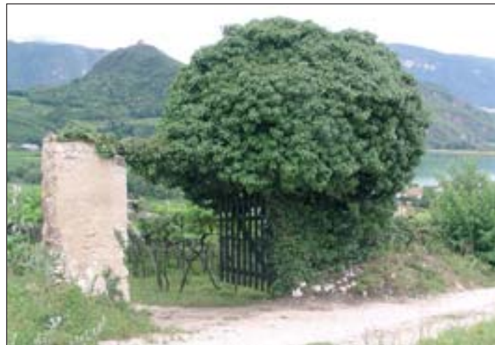
Hecken, Trockenmauern und blühende Wiesen sind in den Tallagen schon fast eine Rarität.

tes werden größtenteils von der Autonomen Provinz Bozen getragen. Unterstützt wird das Projekt auch vom Amt für Landschaftsökologie.