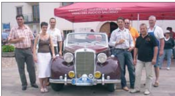
Empfang an der Zieleinfahrt der 4. Vinomiglia-Etappe