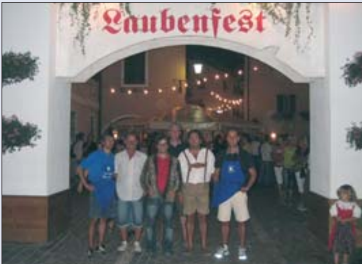
Hic habitat felicitas....

ben. Auch die teilnehmenden Vereine sind mit ganz wenigen Ausnahmen dieselben geblieben. Das Fest ist auch gedacht als Dorffest für die gesamte Bevölkerung aus Neumarkt. Letztes Jahr ist das Fest bei der Bevölkerung von Neumarkt gut angekommen, was wir uns auch heuer wieder wünschen. Ich möchte mich schon im Voraus bei allen Bewoh-