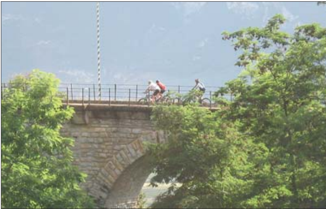
... und über die Glener Brücke mit herrlichen Panorama aufs Unterland/Überetsch.

diese Alternative in den Planungsunterlagen mittlerweile aber nicht mehr auf.