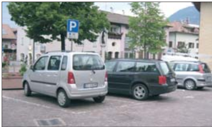
Mehr freie Kurzparkplätze durch Gebühren lautet das Motto ab August in Auer

Ab August werden rund um den Aurer Hauptplatz die Parkplätze neu geregelt. Nach der Eröffnung der Tiefgarage vor einigen Jahren hoffte man im Rathaus das Parkproblem einigermaßen gelöst zu haben, allerdings wurde dieses Angebot aus verschiedenen Gründen nie richtig angenommen.