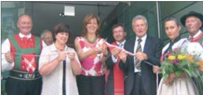
Nur strahlende Gesichter beim Banddurchschneiden