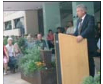
Viele Worte des Dankes vom Bürgermeister