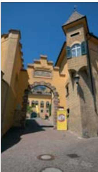
Auffahrt zum Schloss