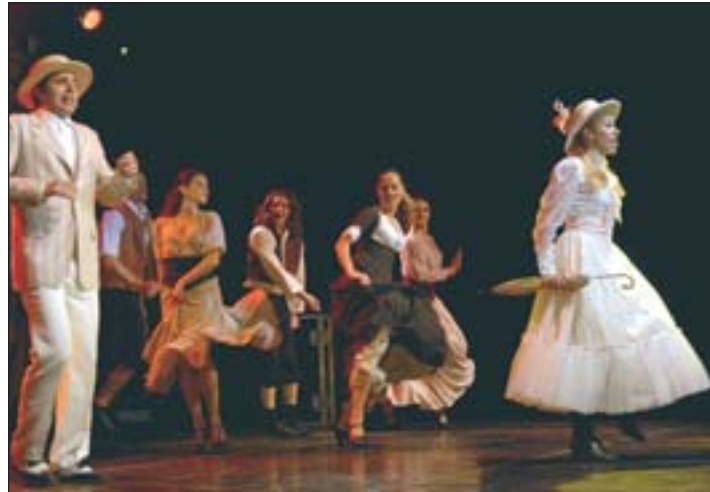
„Fantasy Music Gala“ begleitet das Publikum auf eine stimmungsvolle Reise in die Traumwelt der Musik.

Beginn: 21.00 Uhr Infos und Kartenvorverkauf: Tourismusverein Kaltern Tel. 0471 965436 info@kaltern.com