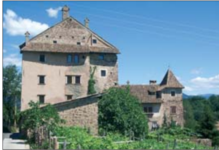
Unter Ensembleschutz „Schloss Moos Süd

einzelnen Bestandteilen auseinandersetzen und sich auch Gedanken über eine mögliche Aufwertung machen.“