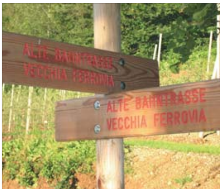
Auch heute schon wird der gut beschilderte alte Bahnweg von vielen als Wander- und Radweg genutzt.

Insgesamt scheint sich das Unterland auf den Radweg auf der alten Fleimstaler Bahntrasse zu freuen. Für die meisten Befragten soll der Radweg werden, auch wenn einige das bezweifeln, wegen einer Steigung von maximal 5 Prozent. Um der Natur gerecht zu werden wird der Radwegbelag kaum asphaltiert sondern mit einer Schotter- Spezialmischung gefestigt. Positiver Nebeneffekt: damit sollen Raser den Radweg meiden. Im nächsten Jahr wird das Ausführungsprojekt erstellt, mit einer Realisierung des Radweges ist nicht vor 2009 zu rechnen. (CB)