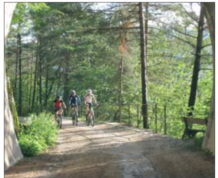
... durch mehrere Tunnels hindurch..