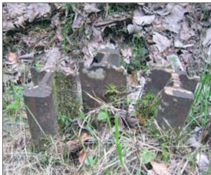
Relikt aus vergangener Zeit entlang des Weges

Auch im restlichen Teil sollen sich die baulichen Eingriffe auf das Notwendigste beschrän-