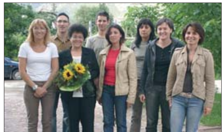
Diesen Damen und Herren wird bald nichts mehr spanisch vorkommen.

Vereine und ihre Mitglieder bis zu einer Höchstdeckungssumme von 4 Mio. Euro bei Personen- oder Sachschäden schützt. Die „große Errungenschaft“ ist laut Bürgermeister Giacomozzi, dass auch Schadenersatzansprüche der Vereinsmitglieder mitversichert sind und auch Personen, denen der gesetzlichen Vertreter des Vereines Aufgaben im Rahmen der Vereinstätigkeit übergibt. Bei dem Informationsabend wurde den Anwesenden nahegelegt, sich als Onlus-Verein registrieren zu lassen, um in den Genuss von Steuerzuwendungen zu kommen. Vorgestellt wurde auch die kommunale Gesundheitsförderung, welche zur Zeit von der Stiftung Vital landesweit vorangetrieben wird und die Verwirklichung konkreter Gesundheitsprojekte auf Gemeindeebene zum Ziel hat