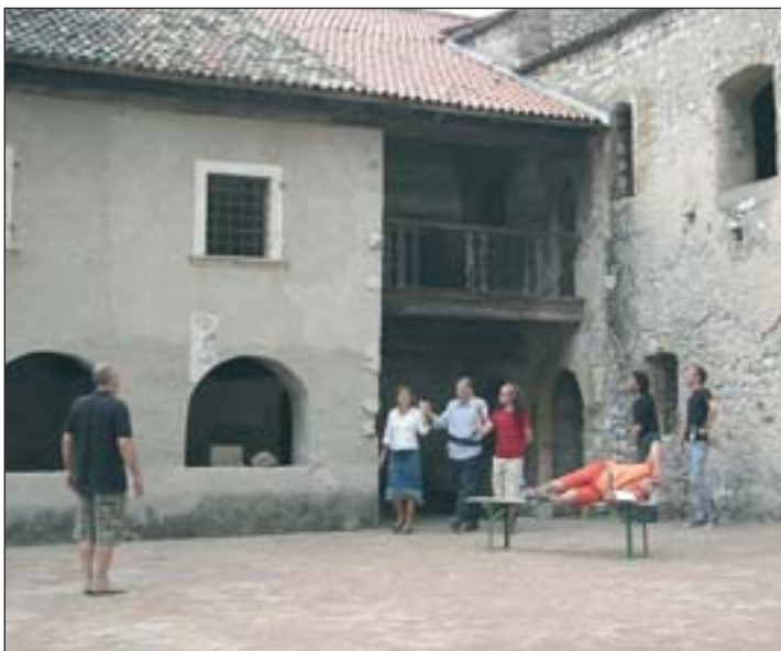
Bei den Proben zur Aufführung