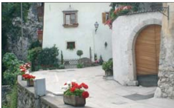
Eine Aufnahme des Blumenwettbewerbs 2006

hat sich das Vereinsprojekt bewährt. Rund 37 Kinder aus Margreid und Fennberg haben sich auch heuer zum beliebten Ferienprojekt angemeldet. Projektsitz ist wiederum Fennberg und Umgebung. Ein mittlerweile routiniertes Betreuerteam wird die Kinder von 7.45 Uhr bis 17.00 Uhr bis zum 10. August mit Spielen und besonderen Aktivitäten betreuen und begleiten. Ausertourliche Projekte in Zusammenarbeit mit verschiedenen Landeseinrichtungen werden auch dieses Jahr mit den Besuchern der Zeltlagergruppen des Jugenddienstes angeboten. Finanziert wird das Projekt durch die Landesregierung, Elternbeiträgen und dem ehrenamtlichen Einsatz durch Vereinsmitglieder. (MK)