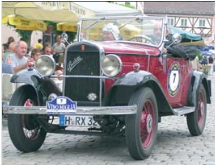
Im Bild die Startnummer 7, ein wunderschöner Fiat Balilla.

die Geheimnisse seiner Schokoladenvariationen in Kombination mit Gewürztraminer oder Grappa ein. Die edlen Kreationen durften natürlich auch verkostet werden.