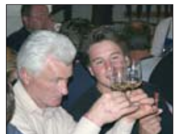
Auch das Publikum war angehalten, ein Urteil abzugeben.

Aber nicht nur die geschulten Geschmacksknospen der Experten waren gefordert. Auch das zahlreich erschienene Publikum war angehalten, anhand von Bewertungsbögen Geschmacksnuancen, Geruchsintensität und Farbschattierungen der Weine festzuhalten, um schließlich das eigene Urteil mit dem der Jury zu vergleichen. Ermittelt wurden die drei besten