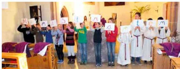
Für ihre Vorstellung beim Familiengottesdienst hatten sich die Ministranten etwas Besonderes einfallen lassen.