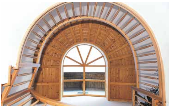
Balkone, Treppen und Geländer ...