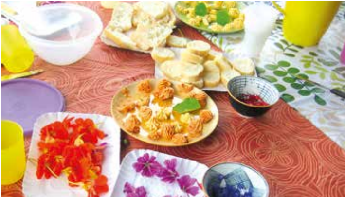
Blütenbrote – schmackhafte Kreationen für Auge und Gaumen.

Gartenfreunde, HobbygärtnerInnen und Interessierte treffen sich am 2. Mai in Kurtatsch zum Kennenlernen und Tauschen von Gartentipps, Pflanzen und Samen