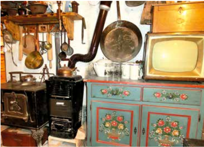
Es gibt nichts, was es nicht gibt