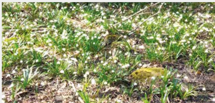
Die ersten Boten kündigen bereits den Frühling an.