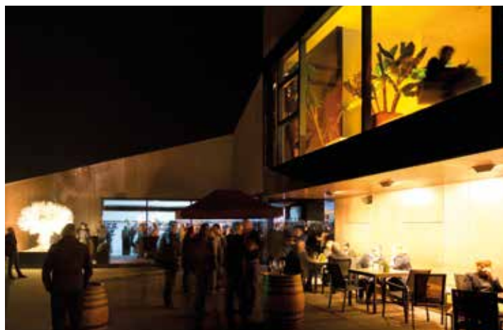
Stimmungsvolle Atmosphäre bei der Vorstellung