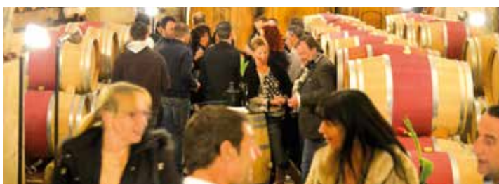
Die Nacht der roten Juwelen lockt jedes Jahr viele Besucher an.

Nacht der Roten Juwelen am 16.04.2015 ab 19 Uhr im Ansitz Freienfeld Kurtatsch Andreas-Hofer-Straße, 39040 Kurtatsch www.kellerei-kurtatsch.it