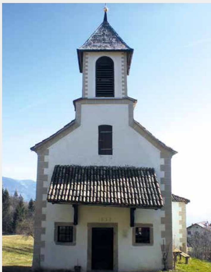
Die Kirche zu den 14 Nothelfern.