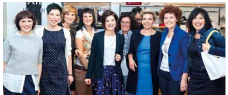
Individuelle Farb- und Stilberatung sorgen für gute Laune.

Artist von Diego della Palma geschminkt und von Sport Sigi eingekleidet. „Ziel des Personal Style Day ist es nicht Frauen zu verändern, sondern durch gezielte Beratung Einzigartigkeiten und die innere Strahlkraft zu verstärken“, erklärten Erika und Martine, kurz ME, im Rahmen der Präsentation. Das gelungene Ergebnis wurde im Anschluss an den erfolgreichen Personal Style Day um 18 Uhr im Geschäft Sport Sigi in Neumarkt präsentiert. Zahlreiche Besucherinnen und Besucher fanden sich zur Präsentation samt Aperitif ein und ließen sich vom gelungenen Ergeb-