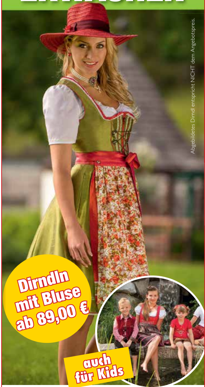
Abgebildetes Dirndl entspricht NICHT dem Angebotspreis.