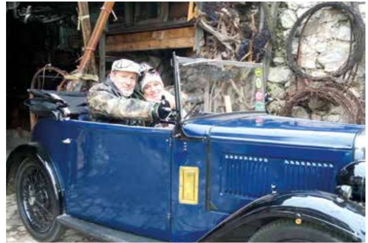
In seinem geliebten Oldtimer, gemeinsam mit einer Filmkollegin beim Dreh einer Chronik