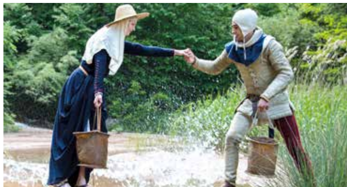
Beim Wasserlochspiel bleibt keiner trocken