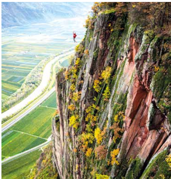
Extrem ausgesetzte 400m hohe Highline bei den Pfattner Wänden, Montigg

Die tollsten Highlines sind ihm in den Dolomiten gelungen, zwei davon sollen hier erwähnt werden. Da ist einmal „die Brigade“ am Pisciadù Klettersteig zwischen dem Exnerturm und dem Pisciadùmassiv. Es war für alle Beteiligten schon deshalb ein besonderer Moment, weil man die Nacht unter einem Felsvorsprung verbracht hat und man bei Sonnenaufgang, in absoluter Stille, die Überquerung der Schlucht gewagt hat. „Sobald man am Anfang der Slakeline sitzt und sich vorbereitet, überfällt einem diese Uragst des Stürzens in die Tiefe. Hat man dieses Gefühl überwunden, hat man ein paar Schritte gemacht, steht man draußen in der Leere, die einen nach unten zieht. Schritt für Schritt geht es weiter, man ist fokussiert auf einen Punkt, auf