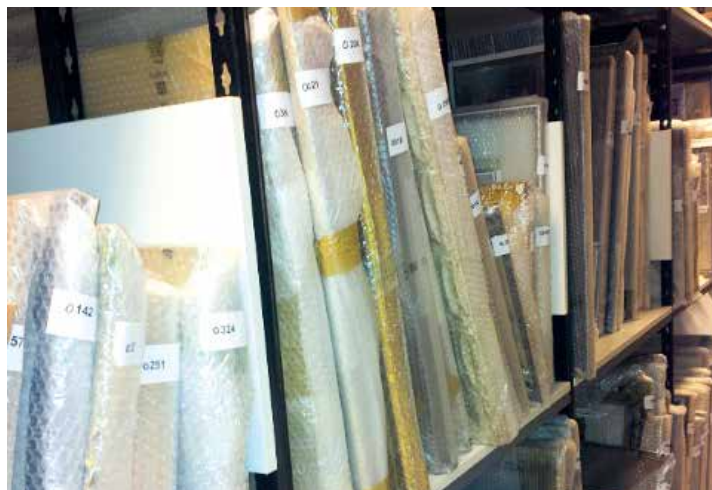
Die Kunstsammlung wurde vorerst im Lanserhaus untergebracht.

Insgesamt kann man sagen: Schade vor allem darum, dass dieses wunderschöne Widumensemble von St. Pauls, das eigentlich allen Pfarrkindern gehört, weiter darauf warten muss, einer sinnvollen Bestimmung zugeführt zu werden. «