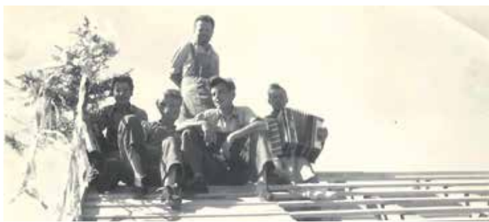
Über 50 Jahre ist es her – jahrelange Erfahrung zeichnet den Betrieb aus

Balkone und überdachte Terrassen bieten zusätzlichen Wohnraum, wenn der vorhandene Platz ideal genutzt wird. Inneneinrichtungen, Ausbau, Balkon- und Fassadenbau sowie Treppensysteme bietet die Firma ebenso an. Treppen sind nicht nur Verbindungen zwischen zwei Ebenen, sondern stilistische Elemente, die den Wohnraum mitprägen, heißt es auf der Homepage der Zimme-