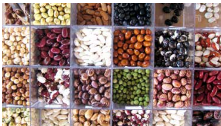
Verkannte Sortenvielfalt: Bohnen gibt es in allen Farben und Formen.