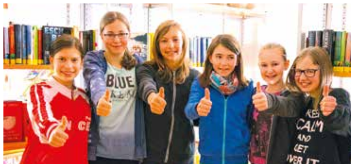
„Mariengartler“ Schülerinnen in der hauseigenen Schulbibliothek.

Als Preis bekamen die Leseprojekt-Gewinner einen Ausflug der besonderen Art, denn auch dieser Ausflug stand ganz im Zeichen der Bücher: ein Ausflug nach München mit Besichtigung des Hanser-Verlags - einem der wichtigsten Verlage im deutschen Sprachraum, der auch sehr tolle Jugendbücher macht. «