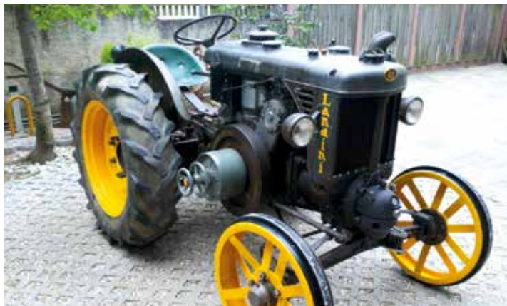
25 PS aus 4312cm 3 Hubraum: der Landini L25-30 aus dem Jahr 1958.

Publikum versprechen die Organisatoren: „Man wird es sich nicht nehmen lassen, die eine oder andere Rundfahrt durchs Dorf zu machen“. «