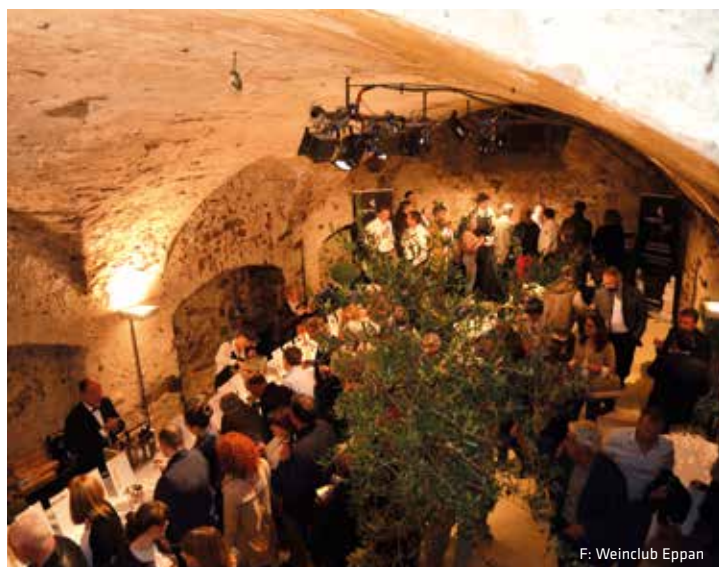
F: Weinclub Eppan

Eintritt: 30,00 Euro Informationen: Weinclub Eppan Tel. 3392945031