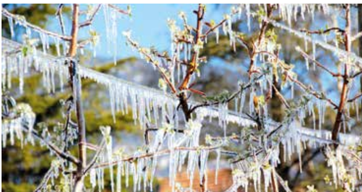
Bizarrr und wunderbar: Eine Obstanlage nach der Beregnung in einer Frostnacht.

Vom Prinzip her klingt das Prinzip des Besprühens der