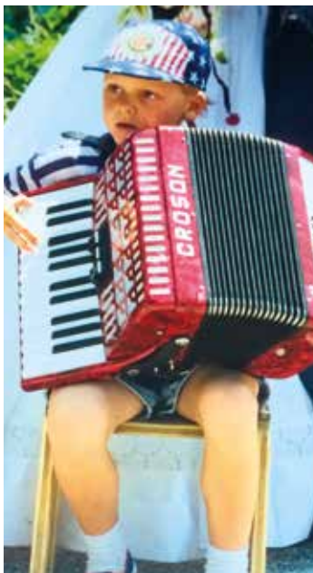
Erster musikalischer Auftritt bei einem Hochzeitsständchen 1994.

Bei der Komposition einer lateinischen Messe gilt es zu bedenken, dass die Melodie den Rahmen des vorgegebenen Textes nicht unter- oder überschreitet. Außerdem hielt ich es für wichtig, den liturgischen Sinn des Textes und des jeweiligen Stückes mit der Melodie und dem harmonischen Zusammenspiel zwischen Orgel und vierstimmigem Gesang möglichst würdig auszudrücken.