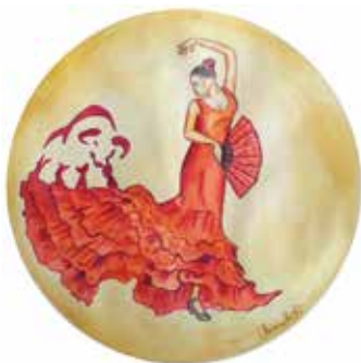
Das Plakat für die Aurer Carmen-Oper