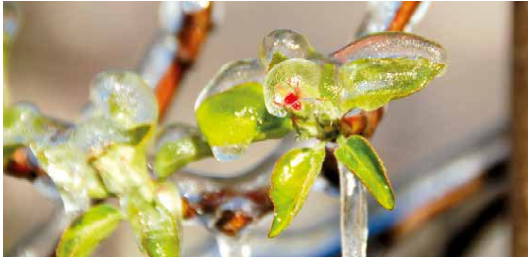
Gut beschützt: die Erstarrungswärme des Wassers umhüllt die empfindlichen Blüten.

Apfelblüten mit Wasser bei Frosttemperaturen auch für Menschen, die nicht mit dem Chemiekasten experimentieren, relativ einfach. Durch die dünne, das Unterland an manchen Frühlingmorgen noch in ein herrliches Eismeer verwandelnde Eisschicht, die sich auf den Blüten bildet, wird nämlich Erstarrungswärme des Wassers freigesetzt. Die Temperatur innerhalb der Eishülle sinkt dabei nicht wesentlich unter den Gefrierpunkt ab und schützt somit die empfindliche Blüte. Dennoch: Umsonst werden sich einige Bauern nicht wie eingeschworene Männergemeinschaften nächtens auf den „Mösern“ in der Talsohle rumtreiben. Für sie sind die Frostnächte weit mehr als nur das Betätigen eines Wasserhahns. Der Einsatz der Frostschutzberegnung funktioniert