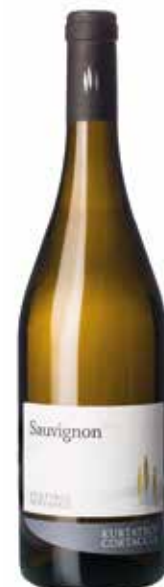
Sauvignon 2014: Kurtatsch im neuen Kleid