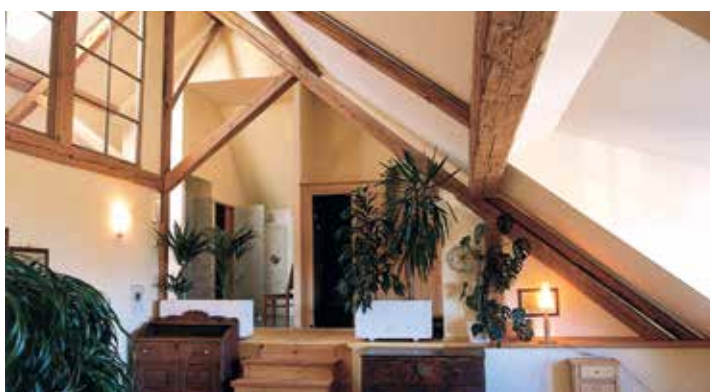
...ebenso wie die Innenraumgestaltung