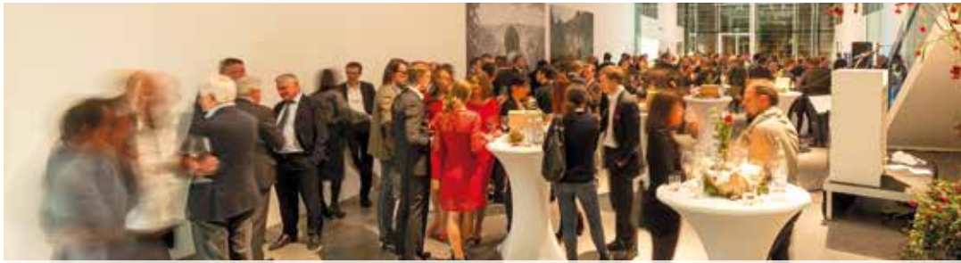
Vor wenigen Wochen feierte das ROI Team sein 20-jähriges Jubiläum.