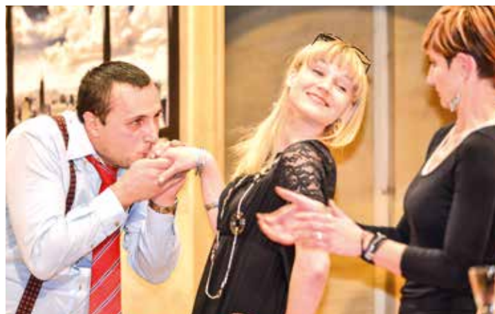
Die Schauspieler verstanden es das Publikum zu unterhalten