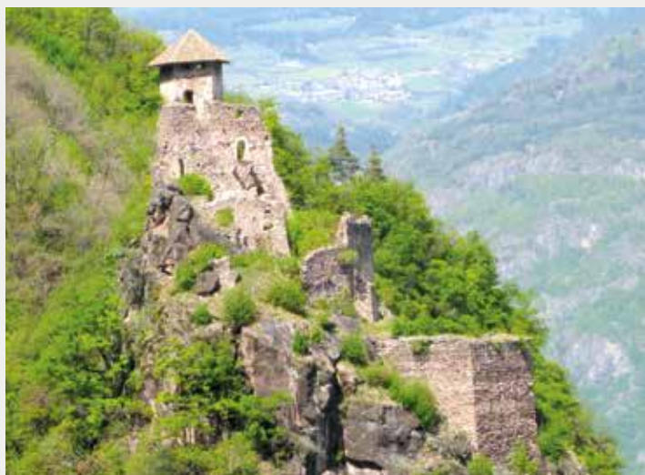
Spektakulär ruht die Burgruine Festenstein über dem Tal.

Nicht mehr allzu weit oberhalb der Burg liegt idyllisch gelegen der sonnenverwöhnte Weiler Gaid. Sein Kirchlein zu den 14 Nothelfern kann von Kunstintereessierten besichtigt werden, den Schlüssel hierzu gibt es bei der direkt daneben liegenden Jausenstation zum Moar. Nach einer Rast geht es nun wieder abwärts, doch im Gegensatz zum schweißtreibenden Aufstieg ist der Abstieg über den schönen Waldweg Larchsteig (Wegweiser nach Nals) ein Genuss: Angenehm abwärts führend queren wir nun den Hang hoch über dem Etschtal und gelangen schließlich zum Buschenschank Bittner, der im Frühjahr und Herbst an den Wochenenden geöffnet ist. Hier biegen wir rechts ab (Nr. 5) und marschieren bei den Höfen Regele und Kofler vorbei durch den schönen Mischwald hinunter zu unserem Ausgangspunkt. Für die gesamte Rundwanderung mit ihren knapp 600 Höhenmetern sollte man etwa 3 Stunden einplanen. Der schwierige Aufstieg durch das Höllensteintal setzt aber eine gewisse Übung und Trittsicherheit voraus! «