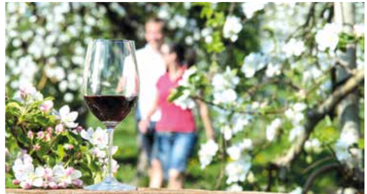
Einen ganzen Tag Kaltern genießen- beim Kalterer Weinwandertag am Sonntag, 26. April.

schmack an. Kunstausstellungen und musikalische Darbietungen runden den Genusstag ab und sorgen für heitere Stunden. Von 10 bis 18 Uhr alle Ecken und Keller in Kaltern erkunden, in Ruhe ein Glas ausgezeichneten Weines verkosten und Schmackhaftes aus der Kalterer Küche genießen – der Weinwandertag in wunderbarer Frühlingsatmosphäre lässt keine Wünsche offen. Weitere Informationen bei wein.kaltern unter T +39 0471 965 410 oder info@wein.kaltern.com .